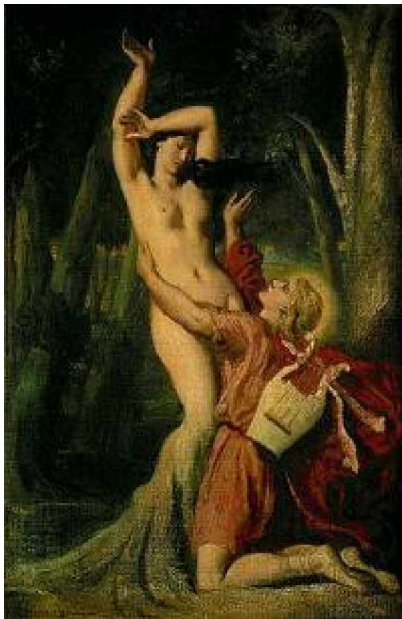
Théodore Chassériau, Apollon et Daphné, avant 1846

Voici la légende (résumée) d'Ovide dont le tableau s'inspire : Daphné est une nymphe, fille du fleuve Ladon et de la Terre. Poursuivie par les ardeurs d'Apollon, elle s'enfuit. Au moment d'être rejointe par le dieu, elle invoque son père qui la métamorphose en laurier. Apollon en fera son arbre sacré.