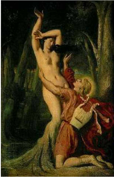
Théodore Chassériau, Apollon et Daphné, avant 1846

Voici la légende (résumée) d'Ovide dont le tableau s'inspire : Daphné est une nymphe, fille du fleuve Ladon et de la Terre. Poursuivie par les ardeurs d'Apollon, elle s'enfuit. Au moment d'être rejointe par le dieu, elle invoque son père qui la métamorphose en laurier. Apollon en fera son arbre sacré.